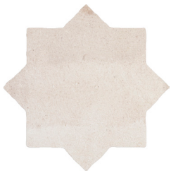
01 | Star Off White