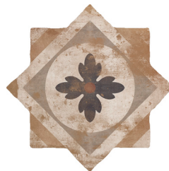
05 | Star Cotto Decor