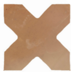
03 | Cross Cotto