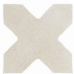
02 | Cross Off White