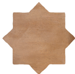
04 | Star Cotto